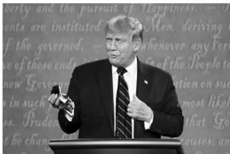
▲9月29日，美國總統候選人首場辯論會上，川普極力嘲諷民主黨候選人拜登是戴著口罩。